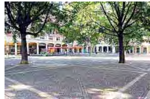
Piazza Matteotti oggi

Il Comitato conferma così di avere le idee chiare su quelli che dovrebbero essere i quesiti da sottoporre alla volontà popolare e lanciano il suggerimento direttamente «alle forze politiche che hanno sottoscritto la proposta di consultazione popolare. Manifestiamo la nostra grande soddisfazione per questa iniziativa di effettiva