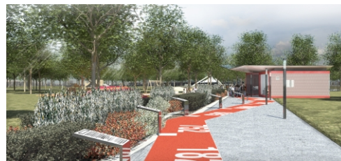
viale di ingresso al parco

RIVISTA/PERIODO DI PUBBLICAZIONE AREA n.115, marzo-aprile 2011, Sistemazione del parco della pace di Nonantola ITALIA OGGI, 30 marzo 2011, pg.20 PAYSAGE n.7, luglio-dicembre 2011