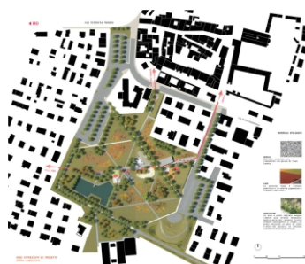
planivolumetrico della proposta

PREMIO PARCO DELLA PACE/ 1° CLASSIFICATO 2011 Proposta ideativa per la sistemazione del Parco della Pace. Comune di Nonantola (MO)