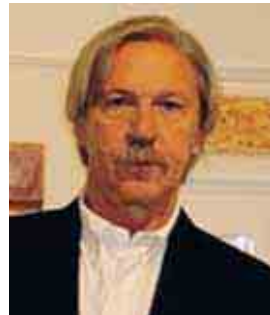
A sinistra, il nuovo progetto di Mario Botta (nella foto in basso) per piazza Matteotti. In alto, da sinistra, Vaccari, Benati e Guerzoni

stravolge l'impianto della piazza». I getti d'acqua che separano virtualmente le due aree sono «qualcosa di vitale, molto meglio di un monumento. Trovo l'acqua che sgorga simbolicamente più consona», spiega l'artista modenese. «Botta è una persona concreta e seria, e con qualche aggiustamento in corso d'opera credo che quella piazza possa diventare un vero luogo d'incontro».