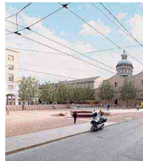
Una veduta della futura nuova piazza

uno spazio verde e ombreggiato per le persone (l'unico del centro) ed un garage per auto sotto uno spazio inospitale; tra una piazza monumentale ed unita sotto alberi maestosi e due aree separate e disseminate di ostacoli, plausibili in un nuovo insediamento periferico, ma non nel cuore della città; tra un ambiente ampio, versatile, utile, frequentato e di nessuna esigenza manutentiva ed una parcellizzazione in aree assolate di manutenzione complessa e laboriosa. E la manutenzione costa ed è virtù addirittura estranea alla nostra cultura. 100 posti auto non risolvono nulla e non valgono la più grande e frequentata piazza della città. Se questa evidenza non balza all'occhio degli amministratori, ci vuole una consultazione popolare. Se il Consiglio Comunale non raccoglierà il nostro appello, lo facciamo i Consigli di Circoscrizione: la parola ai Modenesi!».