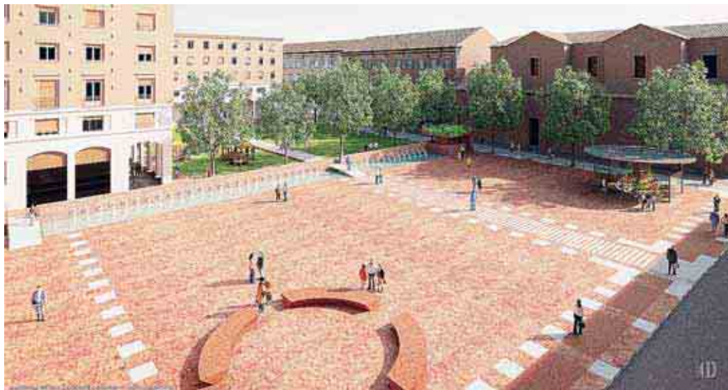
La nuova piazza di Botta: in primo piano la «seduta», sullo sfondo la maxi fontana e il verde, a destra il chiosco

donale, sostituita da un chiosco destinato ad attività commerciali, ma farà la comparsa una grande vasca a velo d'acqua alimentata da 83 zampilli, ognuno dei quali presenterà una formella di artisti locali. Per tutta la lunghezza della fontana sarà ricavata una seduta. Altra novità: sul lato ovest, verso la chiesa del Voto, sarà posizionato un arredo circolare che consentirà di sedersi e sostare nella piazza.