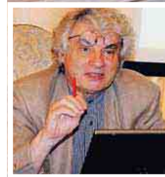
Qui sopra, Mario Botta. In alto la veduta del restyling della piazza da via Emilia centro

rallelo alla via Emilia. Ad unire le due passerelle pedonali. Nel sottosuolo verrà ricavato un parcheggio da 130 posti, con un solo piano interrato rispetto ai due originariamente previsti.